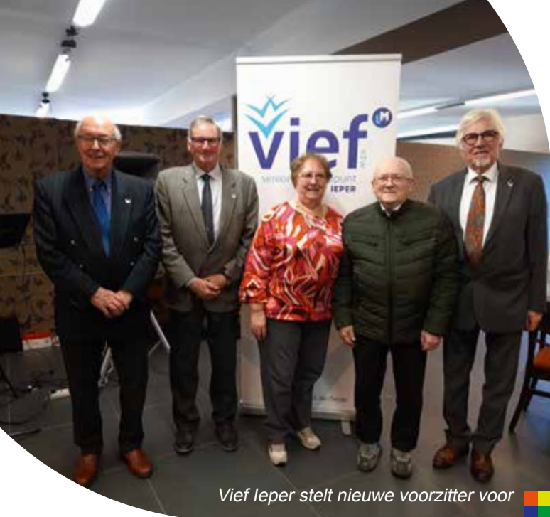
Vief Ieper stelt nieuwe voorzitter voor