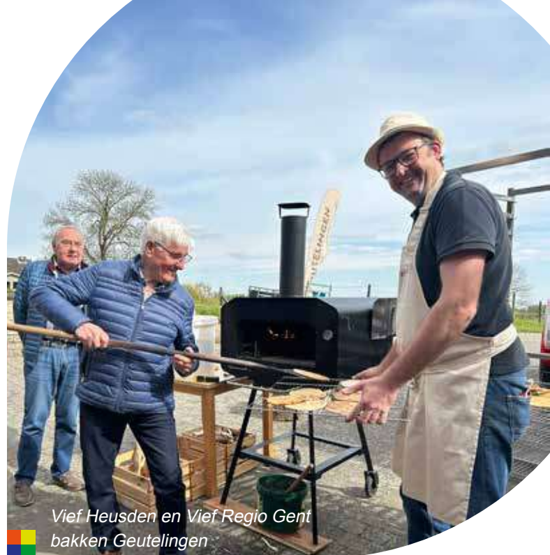
Vief Heusden en Vief Regio Gent bakken Geutelingen

Op 23 april heeft Vief Heusden samen met Vief Regio Gent een bezoek gebracht aan het ovenmuseum in Brakel. Daar kregen ze een woordje uitleg over de geschiedenis van het heerlijke streekproduct en konden de leden hun eigen geuteling bakken. Na het bakken werd er geproefd onder het genot van een koffie.