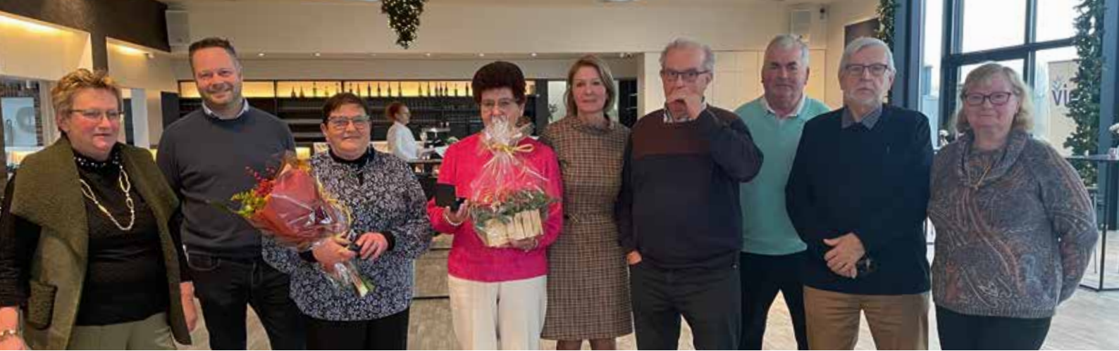
Vief Hooglede-Gits viert 15e verjaardag

Op 25 april 2024 bracht Vief Lokeren een bezoek aan het cosmeticabedrijf Mylène in Heist-op-den-Berg. Een enthousiaste medewerkster gaf ons een rondleiding in het bedrijf en de nodige duiding bij het vervaardigen van het uitgebreide gamma aan producten. Het was leerrijk, interessant en boeiend.