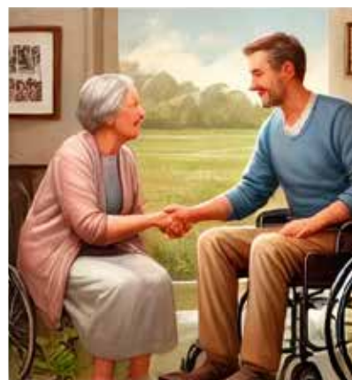
Afbeelding van ChatGPT